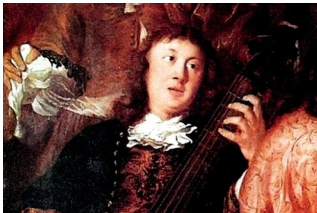
Dieterich Buxtehude (±1637-1707)detail schilderij (1674)van Johannes Voorhout

Op zondag 7 april wordt tijdens de dienst weer een cantate uitgevoerd. Dit keer gaat het om de cantate 'Erstanden is der heilig Christ' van Dietrich Buxtehude (ca. 1637 – 1707) . Deze cantate is geschreven voor 3-stemmig koor, 2 melodie-instrumenten en orgel.